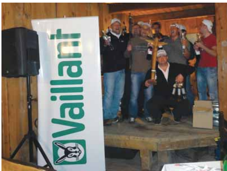
Pobjedničko "indijansko" pleme