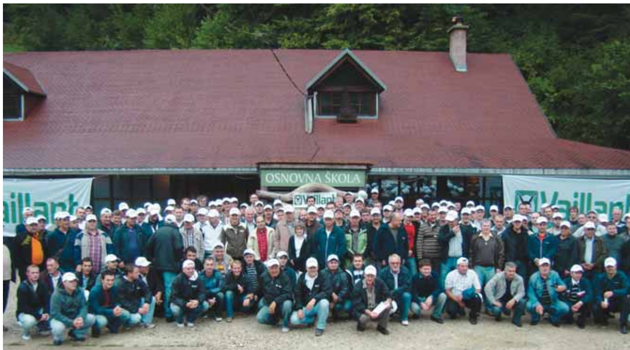
VSS na okupu