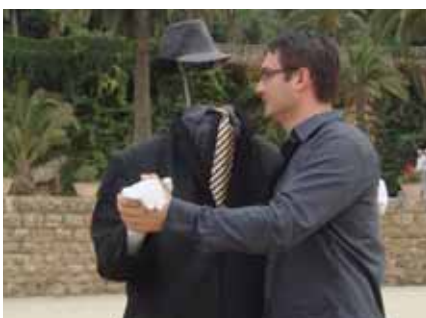
Neki plešu i s ljudima bez glave