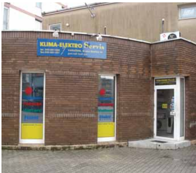
Ulaz u Klima-elektro servis