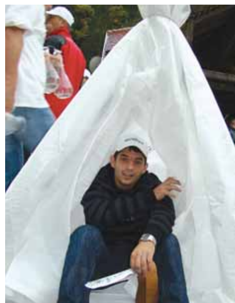
"Indijanac" u svom vlgvamu