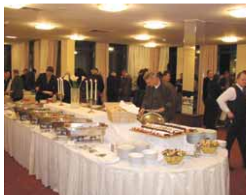
Zagreb - domjenak