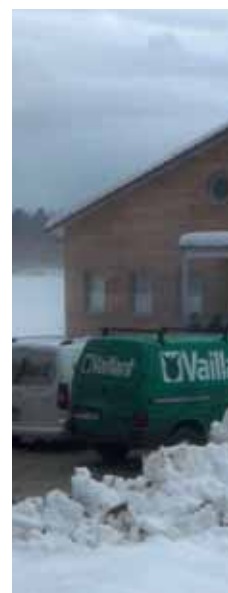
Maglovito jutro ali lijepi