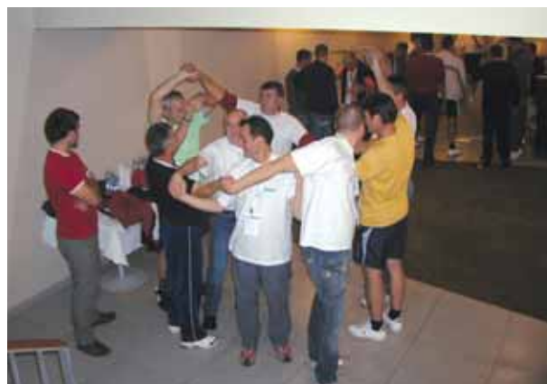
Kako se raspetljati, pitanje je sada