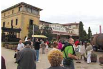
Ispred Freixenet podruma