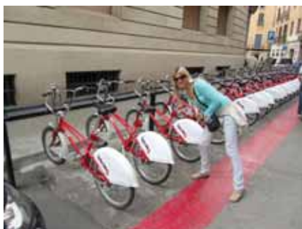
Rent-a-bike u Barceloni