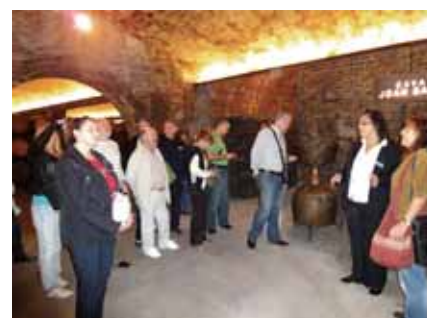
Posjeta Freixenet podrumu