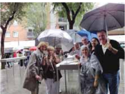
Dobro raspoloženje na Cava Tast sajmu