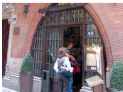
Mjesto prve izložbe Pabla Picassa