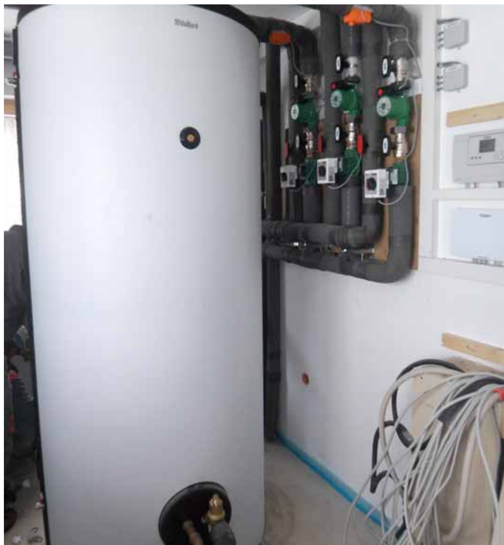
VPA spremnik u kotlovnici