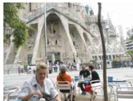
Kavica ispred katedrale Sagrada Familia