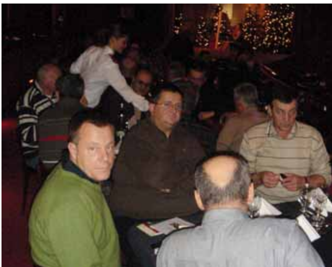
Večera u varijetu „Apolo“