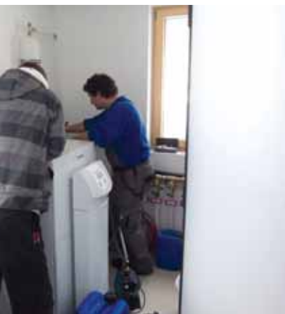
Koncilja pune sustav s antifrizom