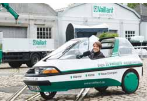
Smiles-ov elektromobil u Vaillantovom dizajnu