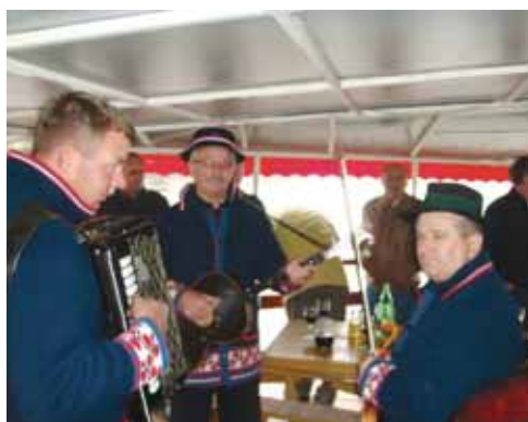
Živike - vožnja brodom po Savi