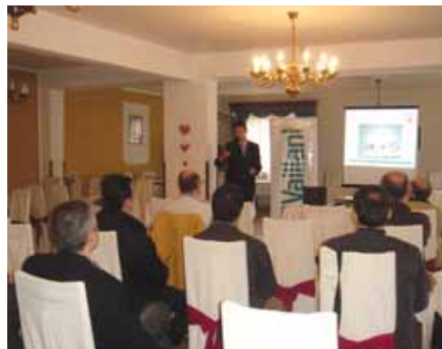
Rijeka - prezentacija

Na kraju možemo samo reći - ponovilo se... I to što prije! K.S.