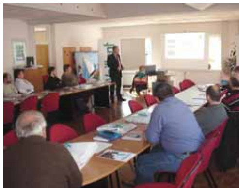
Varaždin - prezentacija