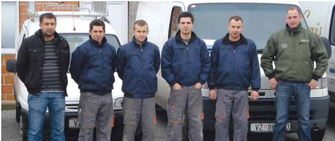
Cijeli tim na okupu