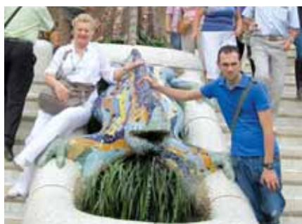
Hoće li gušter postati novi kućni ljubimac?