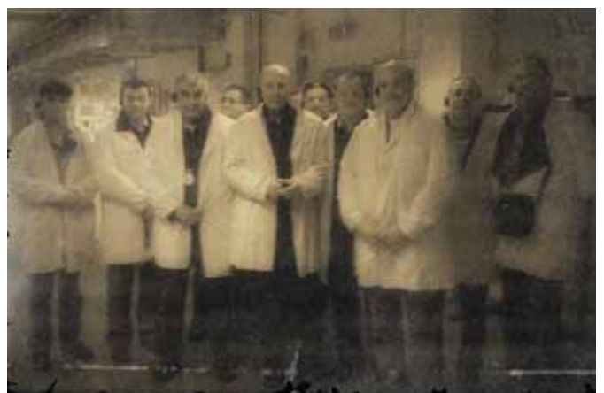
Naši „stari“ asovi