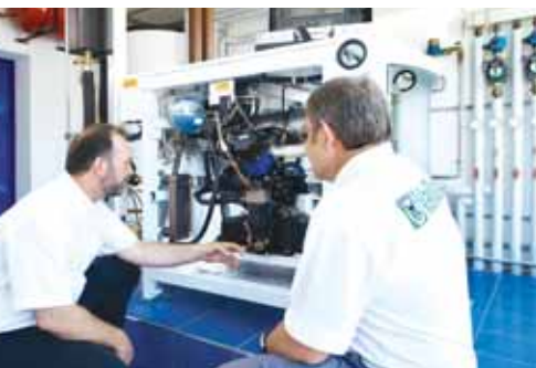
Redovna provjera rada ecoPOWERa

Vaillantov mikro-kogeneracijski sustav ecoPOWER od srpnja ove godine grije i opskrbljuje strujom tvrtku Smiles AG u Donjoj Franačkoj. Međutim, sustavom se dodatno opskrbljuju i električne postaje za punjenje električnih automobila tvrtke. Tako se svi modeli elektromobila od jednosjeda CityEla, preko sportskog modela Tazzari Zero ili četverosjeda Reva NXR pune strujom proizvedenom Vaillantovim mikro-kogeneracijskim sustavom ecoPOWER.