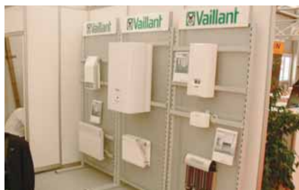
Izloženi električni program

Ovogodišnji, petnaesti po redu, međunarodni sajam graditeljstva SASO Split, održan je u razdoblju od 20. - 24.10.2010. Vaillant, kao generalni pokrovitelj sajma, predstavio se na izložbenom štandu od 32 m 2 , u sklopu kojega smo posjetiteljima željeli pokazati sve novitete iz prodajnog programa, s naglaskom na solarne sustave te električni program. Od izložbenih eksponata svakako bismo istaknuli solarni sustav auroSTEP plus sa zaštitom od pregrijavanja, modularni spremnik ogrjevnice vode allSTOR VPS/2 kao energetska centralu svakog većeg sustava grijanja, novu generaciju električnog kotla eLoBLOCK/2 te novu generaciju klima uređaja climaVAIR VAI 2.