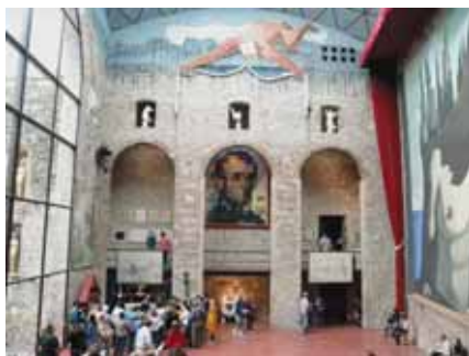
Dalijeva Gala ili Abraham Lincoln?