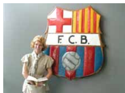
Da li FC Barcelona ima novu navijačicu?