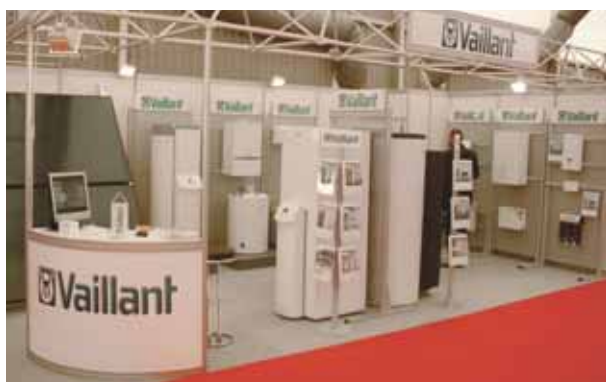
Pogled na štand