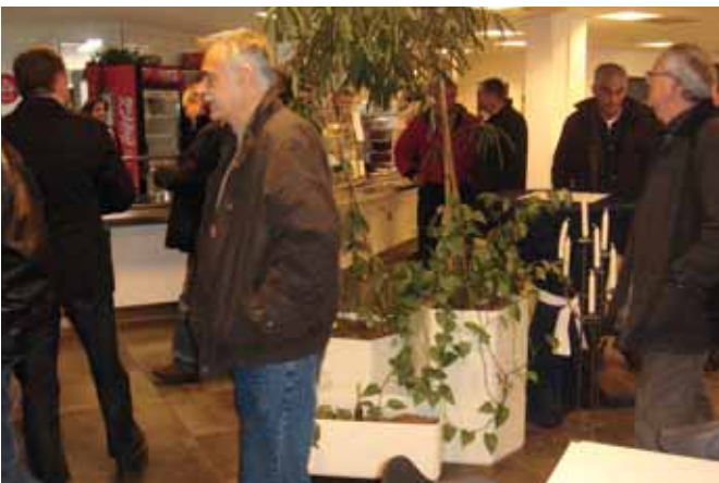
Kratka pauza u kantini