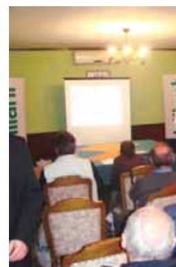
Radinje - prezentacija