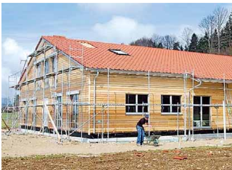
Gradnja objekta Barka u proljetnim mjesecima