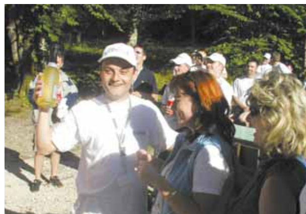
Zasluženi pobjednički šampanjac