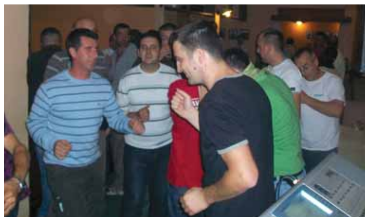
Pjesma, ples i dobra zabava