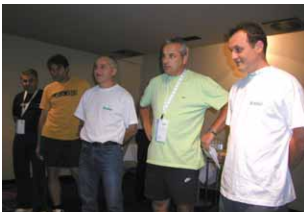
Sudjelovanje u timskim igrama