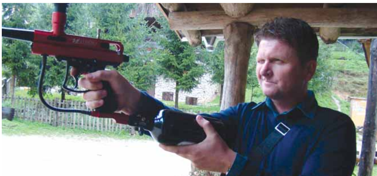
...a neki u preciznom gadanju