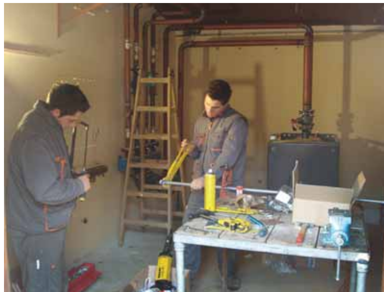
Dečki na jednom od objekata