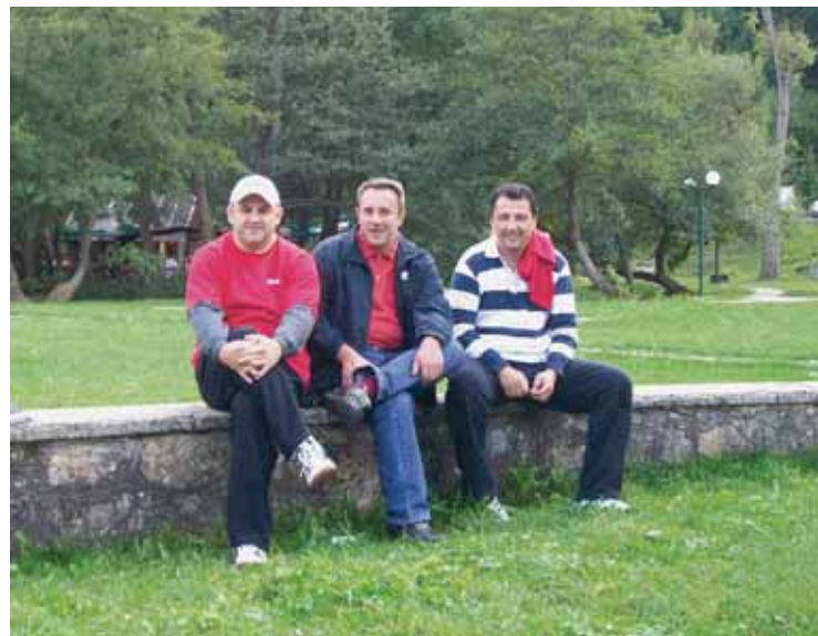
Uprava tvrtke Luk d.o.o.