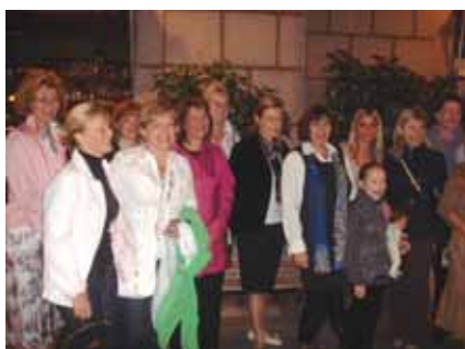
Ljepši dio grupe na okupu

Sljedećeg dana, u petak, odmah nakon doručka krenuli smo u organizirani razgled grada. Barcelona je zapravo Gaudijev grad (Antoni Gaudi, 1852. - 1926.; arhitekt i umjetnik). Na svakom koraku ovaj genijalni umjetnik ostavio je svoj osebujan trag. Ne čudi što nas je razgled odmah na početku odveo do najpoznatije znamenitosti - katedrale Sagrada Familia, s 18 tornjeva, od kojih 12 predstavlja 12 apostola, 4 predstavljaju 4 evanđelista, jedan djevicu Mariju i jedan Isusa Krista. Ujedno njegov najveći projekt, započet davne 1884., Sagrada Familia 84 godine nakon Gaudijeve smrti još nije dovršena. Ljubav i odanost prema i najmanjem detalju jednako zbunjuje i očarava. Završetak je prema najnovijim procjenama predviđen za 2026. Nadahnuti prvim utiscima krenuli smo dalje kroz središte grada prema Parku Güell. Neobične kreacije vrtova i arhitektonskih rješenja razlog su da je danas ovaj gradski vrt, nastao prema Gaudijevom nacrtu, pod zaštitom UNESCO-a.