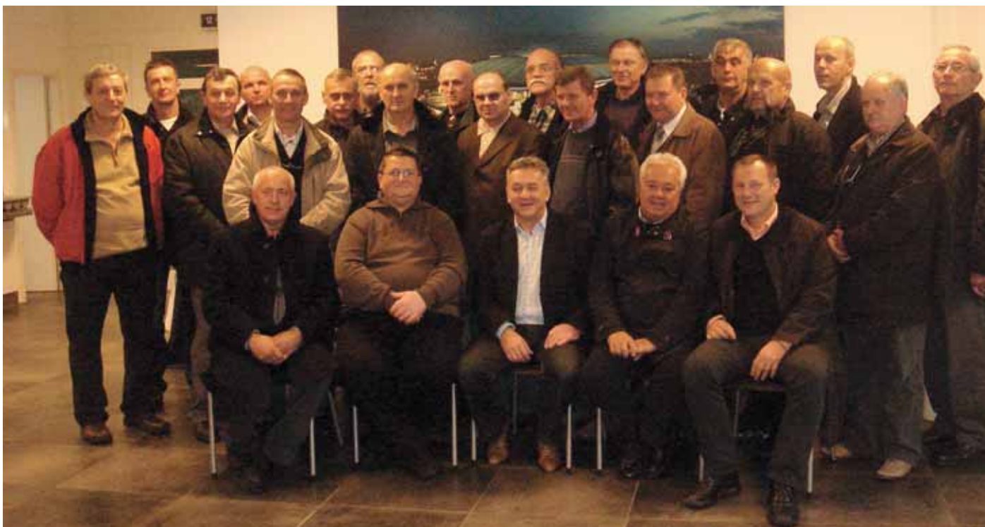
Zajedničko fotografiranje za uspomenu