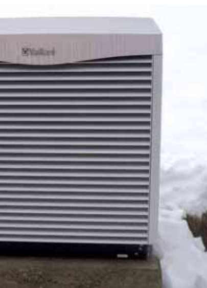
THERM VWL S