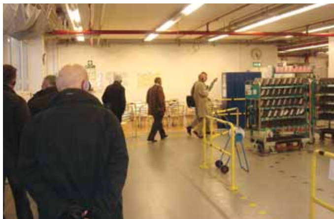
Obilazak proizvodnje u pogonu u Remscheidu

Stariji partneri, koji su prije dvadeset do trideset godina posljednji puta posjetili tvornicu, bili su zadivljeni napretkom tehnologije u proizvodnji uređaja. U jednom pogonu mogli smo vidjeti kako radnici u pauzi za rad vježbaju te tako pokušavaju ostati u dobroj formi i smanjiti mogućnost ozljeđivanja na radu uslijed napornoga rada. Sve to govori kako tvrtka Vaillant vodi i iznimnu brigu o zdravlju svojih radnika. Prije polaska u hotel okrijepili smo se i zahvalili ljubaznim djelatnicima u Remscheidu na prigodnim poklonima. Uslijedio je zanimljiv večernji program u varijetu „Apolo“ u središtu Düsseldorfa, gdje smo uz ukusnu večeru pogledali brojne akrobacije i talente umjetnika s raznih strana svijeta.