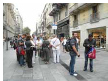
Trenutak za orijentaciju