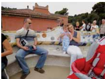
Predah u Parku Güell