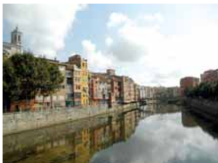
Slikovite fasade u Gironi