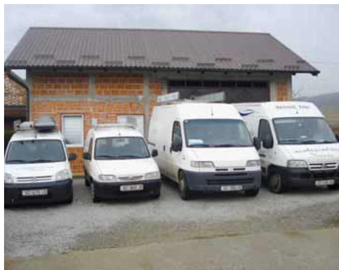
Kompletan vozni park