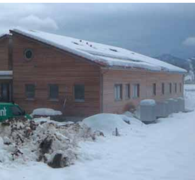
dan za Barku