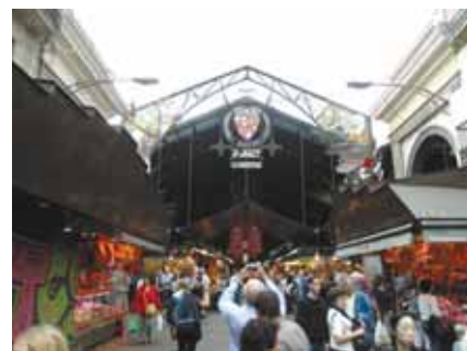
Ulaz na tržnicu La Boqueria