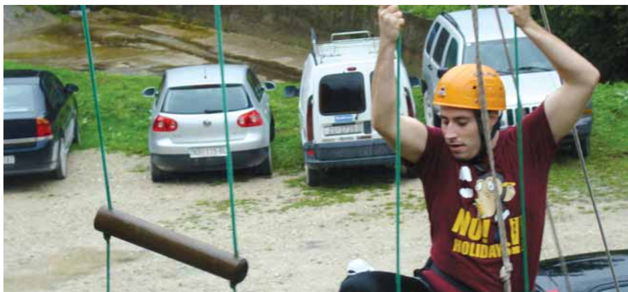
Neki "indijanci" su se okušali u penjanju