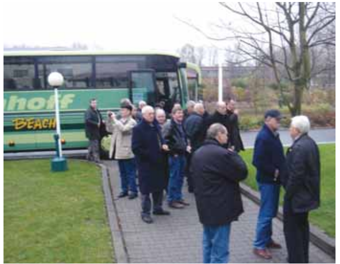
Na ulasku u proizvodni pogon u Gelsenkirshenu