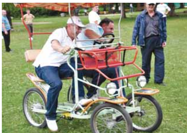
Borba za prvo mjesto, samo naprijed!