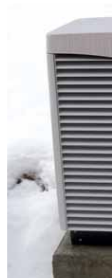
Vanjska jedinica geo