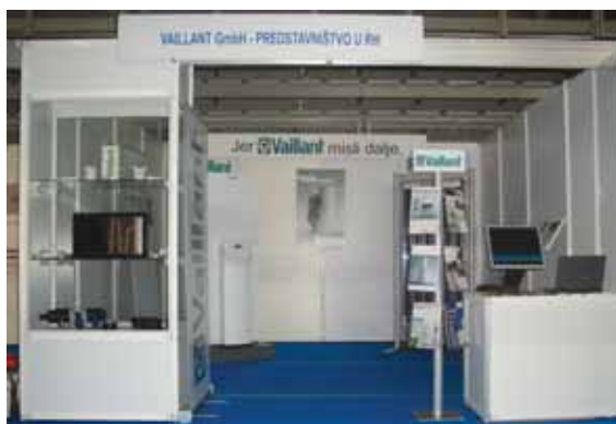
Vaillantov prostor za izlaganje

Vaillant GmbH imao je i svoj izlagački prostor na kojem je prezentirana toplinska crpka geoTHERM i vakuumski cijevni kolektor auroTHERM exclusiv. Osim izložbenih eksponata posjetitelji su mogli dobiti i različite materijale, ali i kvalitetne informacije, o proizvodima i sustavima te je veliko zanimanje vladalo za izvedene objekte s toplinskim crpkama i solarnim termalnim sustavima.