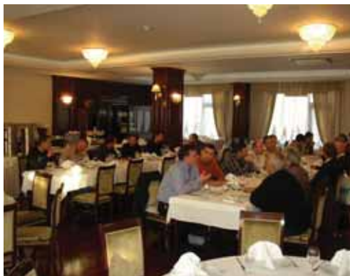
Solin - domjenak

U mjesecima listopadu i studenom održan je niz prezentacija za projektante. Ove smo se godine radi lakšeg dolaska partnera na prezentacije odlučili na regionalne skupove, što je naišlo na njihovo odobravanje te se odrazilo odličnom posjećenošću.