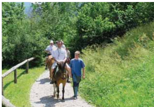
Konačno "na konju"

Budući da je gospodin Damir kupio obrt s uhodanim poslom i stalnim mušterijama, početak poslovanja bio je samo