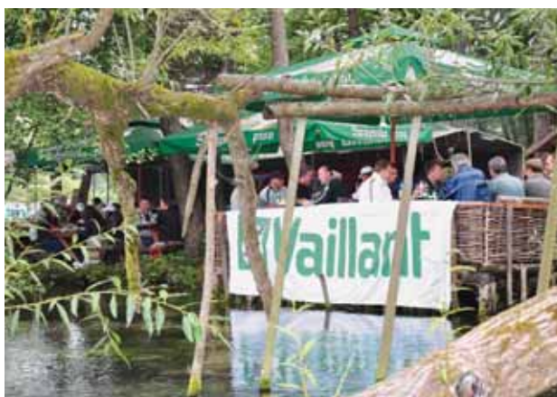
Pripreme pred natjecanje