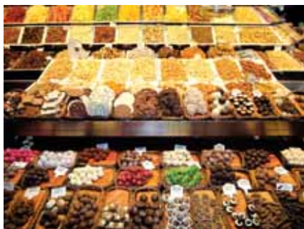
Utisci sa tržnice