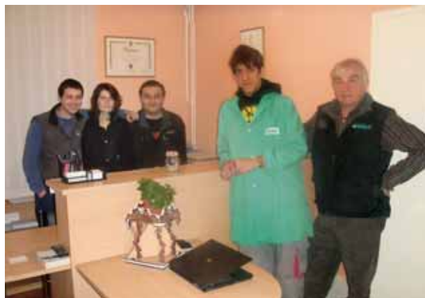
U Plinskoj Laterni svi se dobro slažu