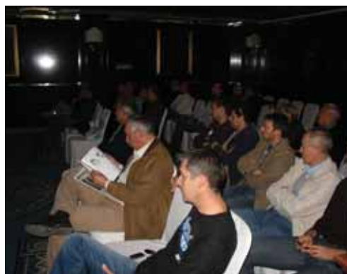
Solin - prezentacija

Teme samih prezentacija nastojali smo prilagoditi određenim područjima Hrvatske, no osnovna misao bila je predstaviti objekte u koje je ugrađena raznolika Vaillantova oprema te na taj način projektantima dati uvid da smo sposobni pružiti tehničku podršku i u slučaju najkompleksnijih zahtjeva krajnjih korisnika.