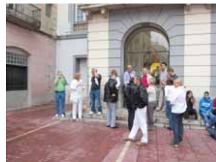
Okupljanje ispred Dalijeovog muzeja

Sljedeće odredište začudo nije obilježeno Gaudijem, već nečim sasvim drugim - sportom. Posjetili smo stadion Nou Camp, širom svijeta poznatog, katalonskog, nogometnog kluba FC Barcelona. Osim veličine stadiona, koji može smjestiti 120.000 gledatelja, impozantan je i prostor sa svim osvojenim pokalima. FC Barcelona, ili od milja nazvan Barca, za Katalonce predstavlja više od nogometnog kluba. On predstavlja katalonsku tradiciju i ponos neovisno o ljubavi prema nogometu.