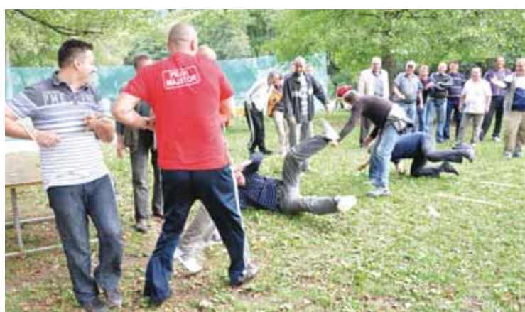
Više sreće drugi put...