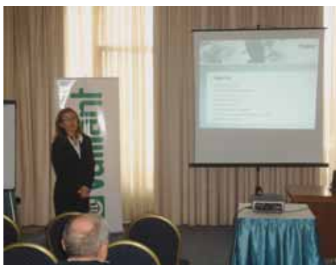
Pula - prezentacija

Teme samih prezentacija nastojali smo prilagoditi određenim područjima Hrvatske, no osnovna misao bila je predstaviti objekte u koje je ugrađena raznolika Vaillantova oprema te na taj način projektantima dati uvid da smo sposobni pružiti tehničku podršku i u slučaju najkompleksnijih zahtjeva krajnjih korisnika.