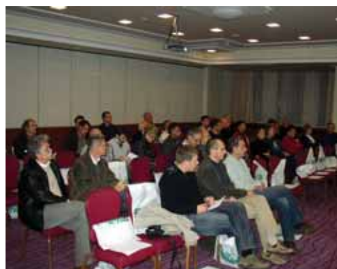
Zagreb - prezentacija