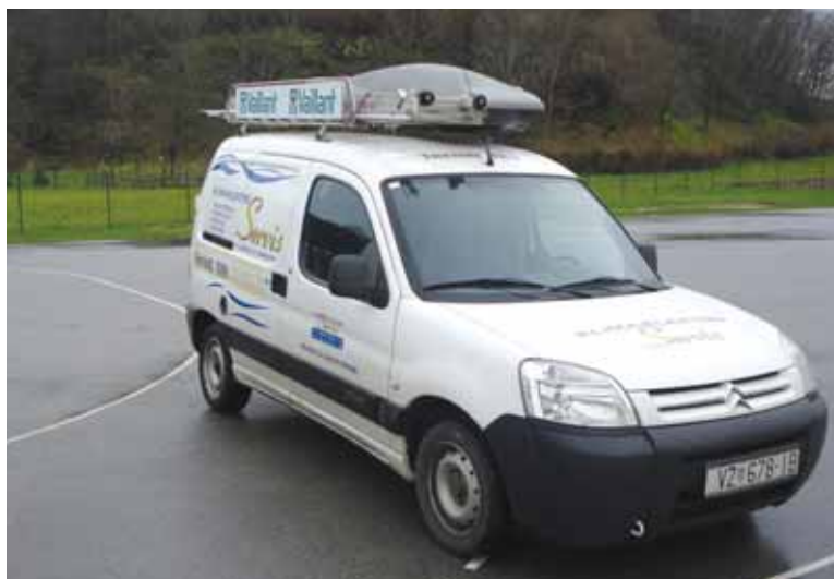
Sva vozila su brendirana