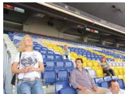
Stadion Camp Nou osvaja svakoga