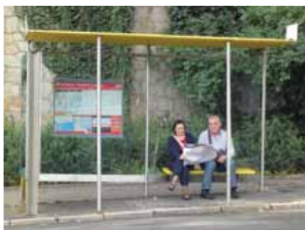
Mali predah na autobusnoj stanici