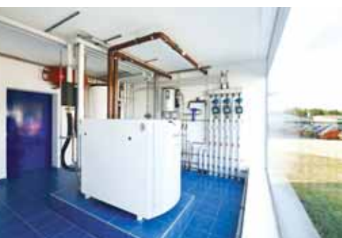
ecoPOWER u središnjoj kotlovnici