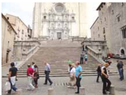
Ispred katedrale u Gironi