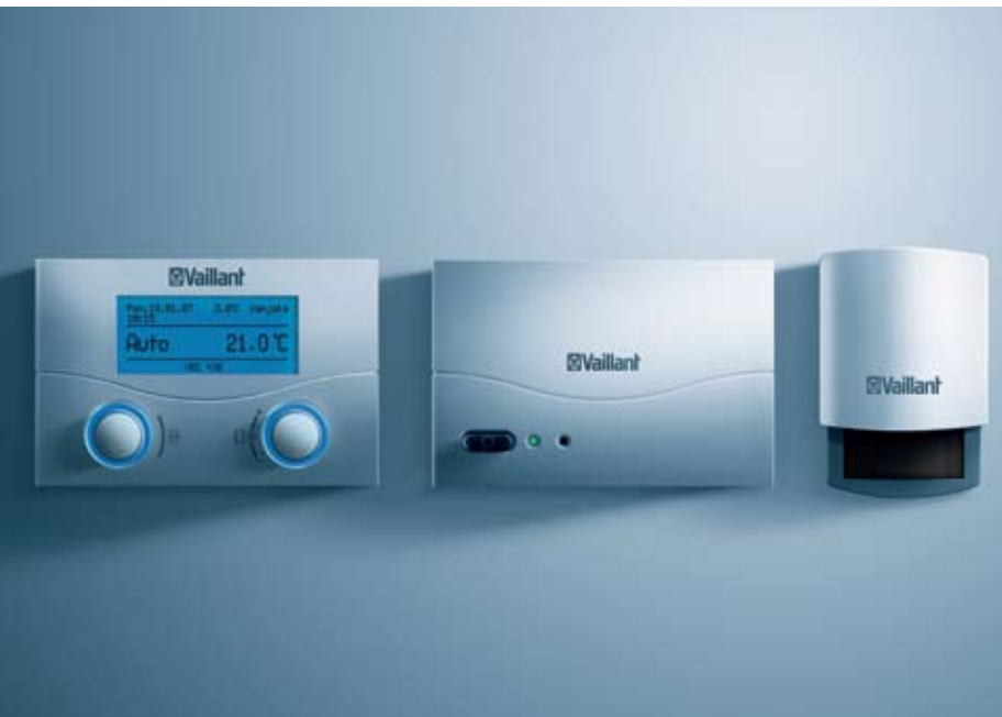
calorMATIC 430f (predajnik, prijemnik, vanjski osjetnik)