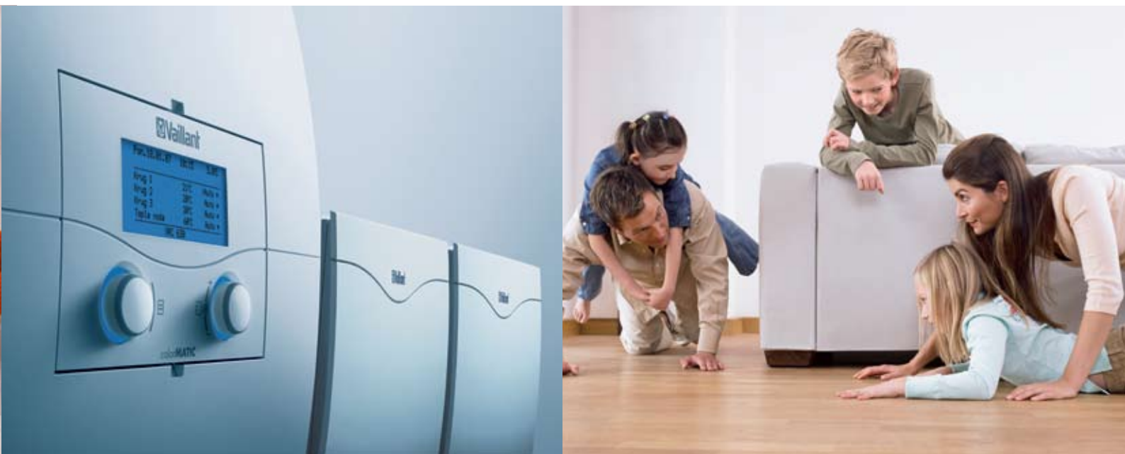
calorMATIC 630 u kombinaciji sa dva modula VR 60