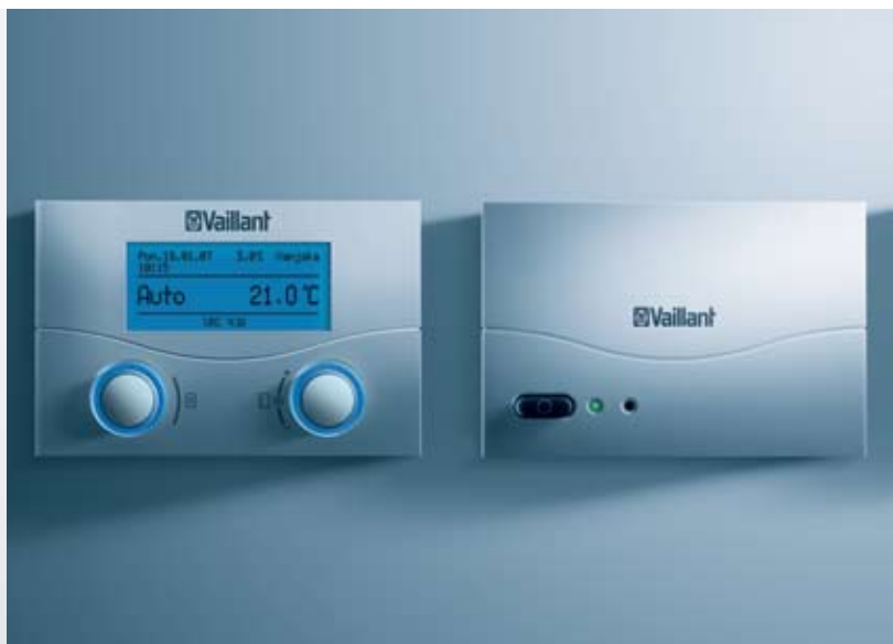
calorMATIC 392f (predajnik; prijemnik)