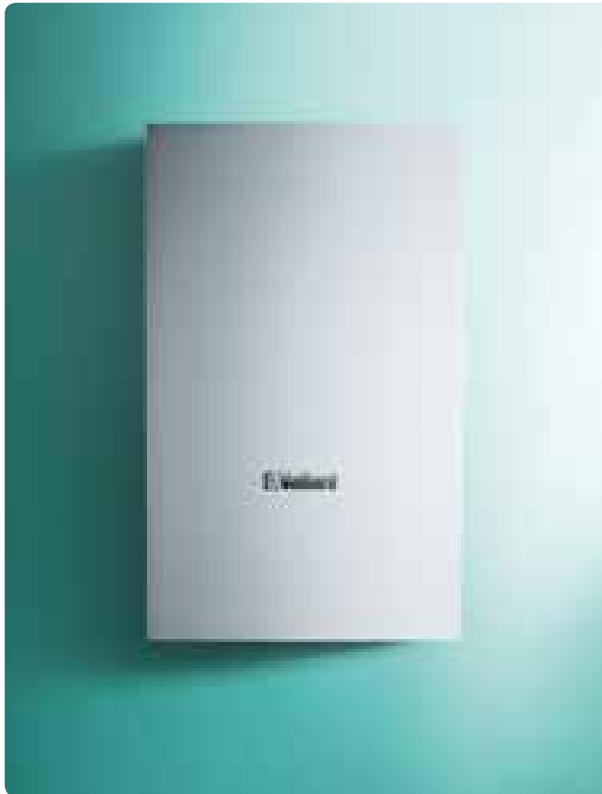
VIH Q 75 B