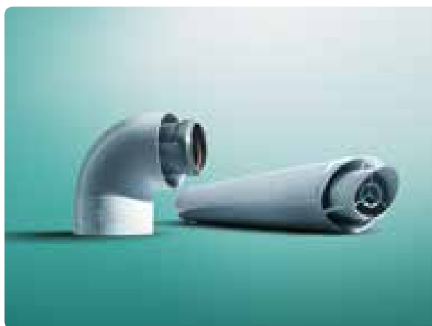
Vodoravni zrako-/dimovodni komplet

Za sustave grijanja s više krugova grijanja neophodno je imati odgovarajuću cijevnu grupu koja će osigurati distribuciju topline od proizvođača do potrošača topline. Vaillant u svojoj ponudi ima više modela cijevnih grupa: sa i bez trosmjernog ventila, s visokoefikasnom crpkom.