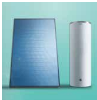
VFK 125/3 + VIH S 300 L