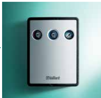
Solarna cijevna grupa