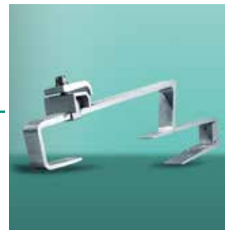
Krovni nosač tip P (za standardni crijev)