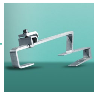
Krovni nosač tip P (za standardni crijev)