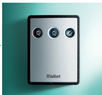
Solarna cijevna grupa