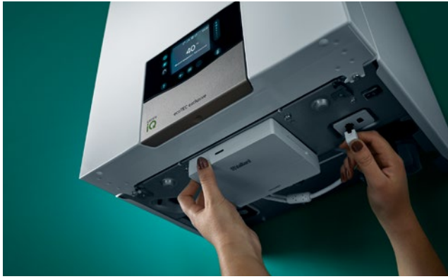
Instalirajte sustav sensoNET u tren oka