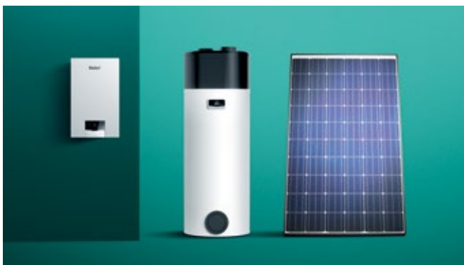
Fleksibilna integracija u sustav.

Novi usklađen dizajn i koncept rada sučelja naših plinskih kondenzacijskih uređaja za grijanje zajedno s našim regulatorima, ugradnju i korištenje čini bržim no ikada. Brza daljinska provjera i prilagodba uređaja za grijanje putem našega novog sensoCOMFORT regulatora i aplikacije sensoAPP.