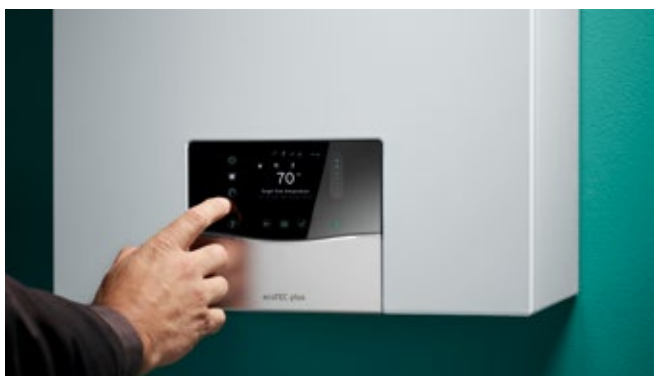
Udobnost upravljanja putem integriranog rada na dodir

Novi usklađen dizajn i koncept rada sučelja naših plinskih kondenzacijskih uređaja za grijanje zajedno s našim regulatorima, ugradnju i korištenje čini bržim no ikada. Brza daljinska provjera i prilagodba uređaja za grijanje putem našega novog sensoCOMFORT regulatora i aplikacije sensoAPP.