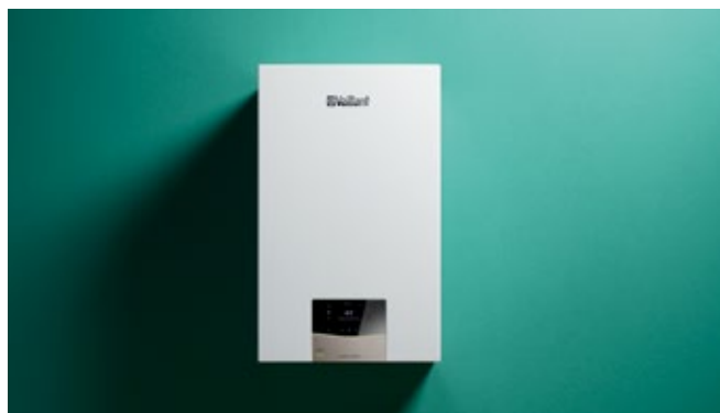
ecoTEC plus VUW

Zahvaljujući njegovoj novoj inteligentnoj značajki „IoniDetect“, uređaj potpuno samostalno upravlja promjenama u vrsti i kvaliteti plina. Svojim kupcima uvijek možete jamčiti optimalno izgaranje, a da sami niste morali ništa učiniti.