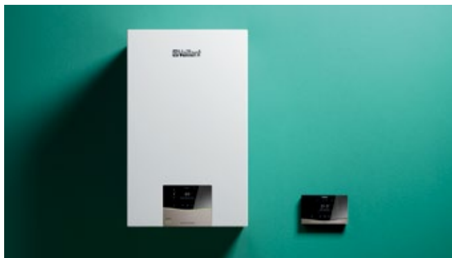
ecoTEC exclusive uređaj sa sensoCOMFORT regulatorom

uređaji opremljeni izmjenjivačem topline od nehrđajućeg čelika za najbolji mogući rad. Uz dokazane i pouzdane komplecte za ugradnju, uvelike vam olakšavaju montažu. Zahvaljujući uklonjivim dijelovima kućišta, sve su glavne komponente savršeno dostupne za lako održavanje.