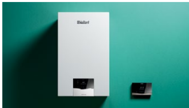
Najbolji omjer cijene i radnih značajki: Povežite ecoTEC plus uređaj sa regulatorom sensoHOME